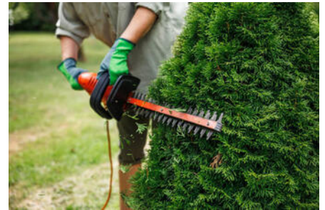
Entretien de la végétation