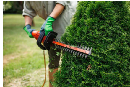
Entretien de la végétation