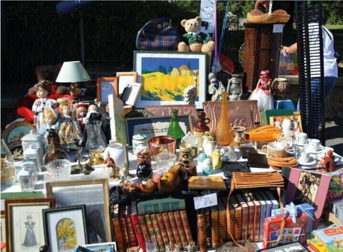
Vide-greniers 38160 Saint-Marcellin Vide-greniers tous les premiers dimanches du mois Plus d'infos Jeu. 11 juin