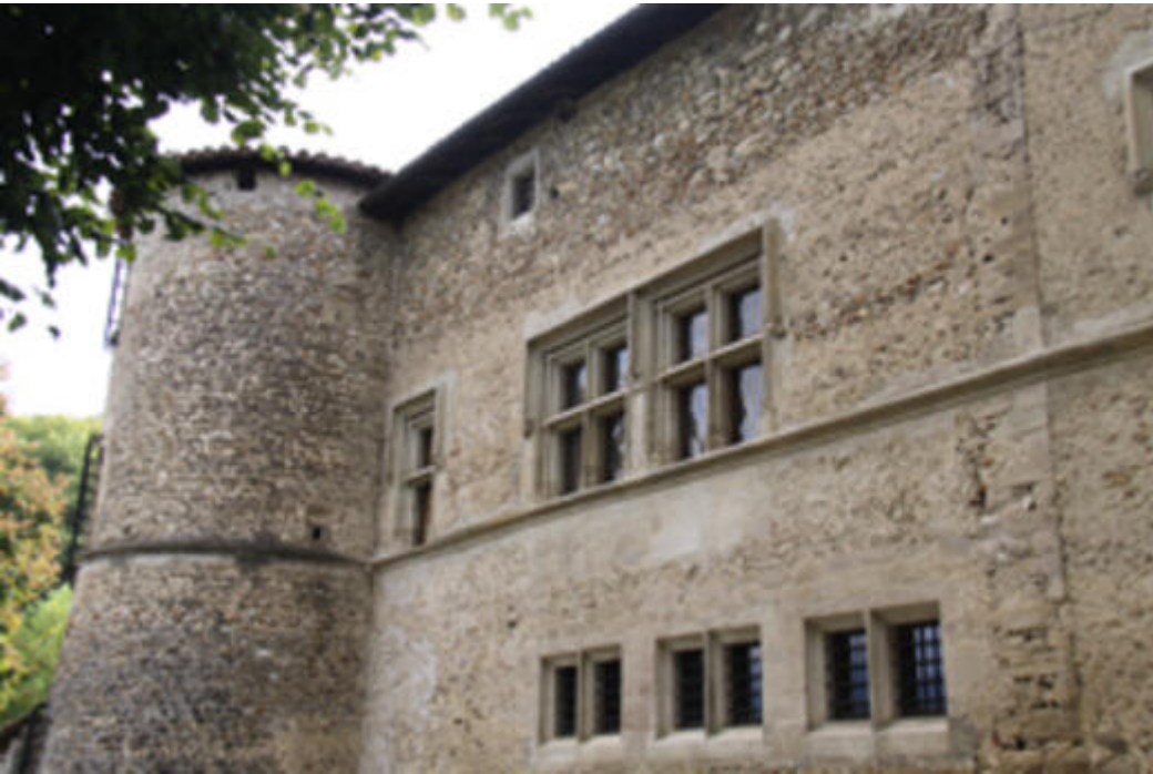
le Château de Quincivet