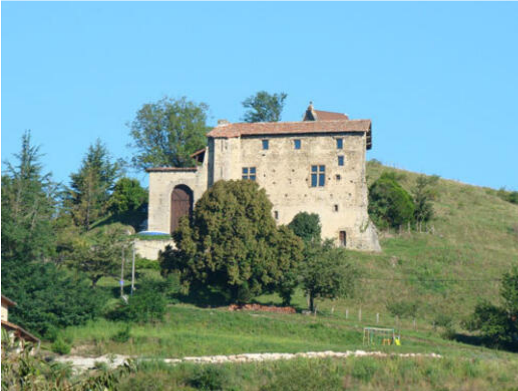
Château du Golard

La commune de Saint-Vérand a été formée par la réunion, en janvier 1791, des deux paroisses de Saint-Véran et de Quincivet. Par convention, Saint-Véran - sans d final - représente la paroisse et la communauté de l'Ancien Régime et Saint-Vérand - avec d final - l'actuelle commune née de la Révolution.