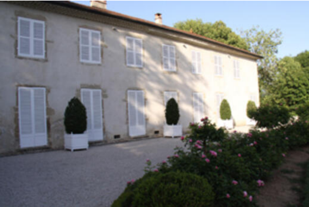
Le Château de la Gaucherie