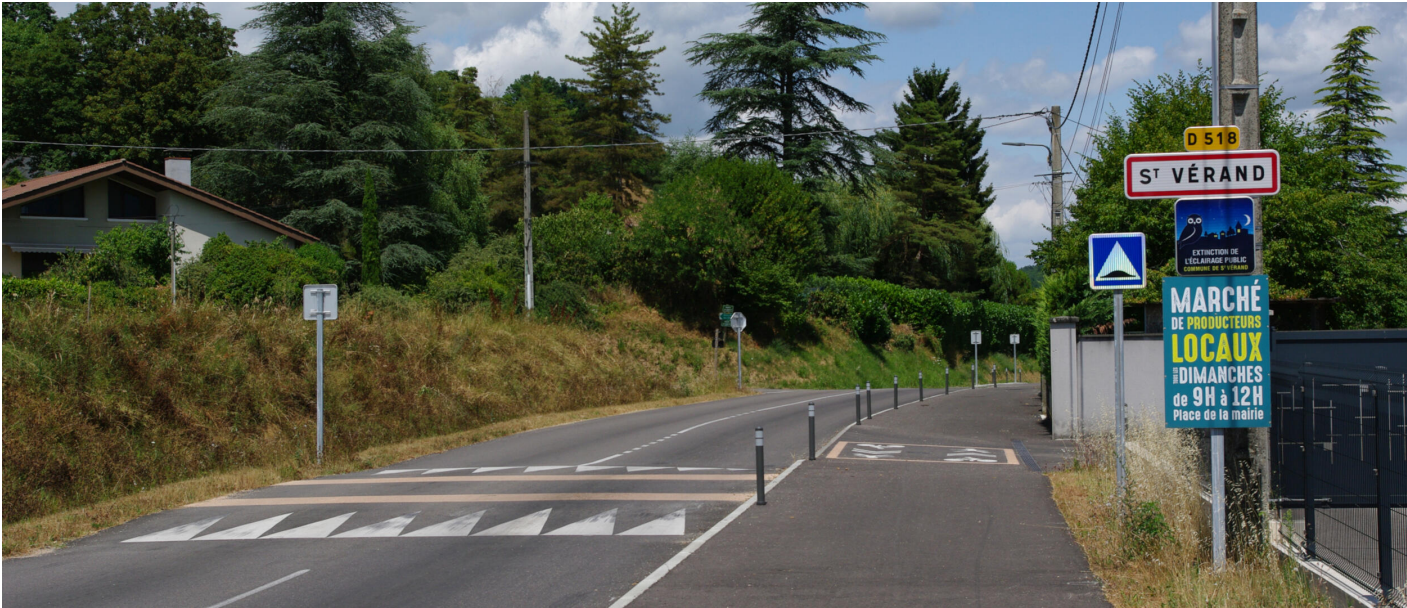
Découvrir la commune