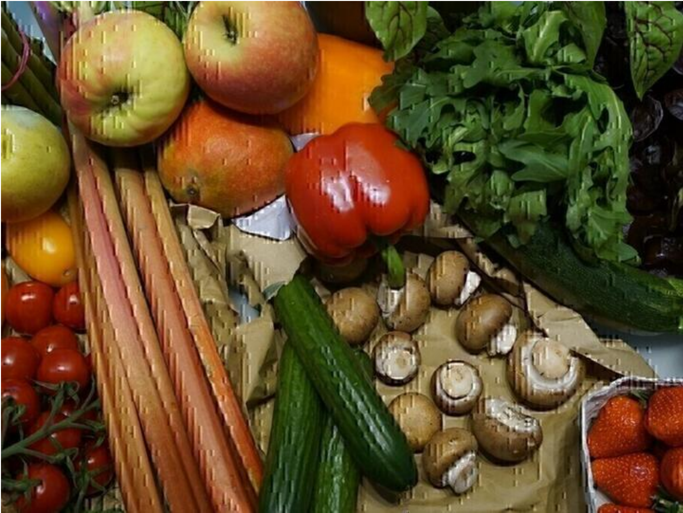
Marché de Producteurs locaux 38160 Saint-Vérand Marché de producteurs locaux, convivial et gourmand ! Plus d'infos sam. 25 juil.