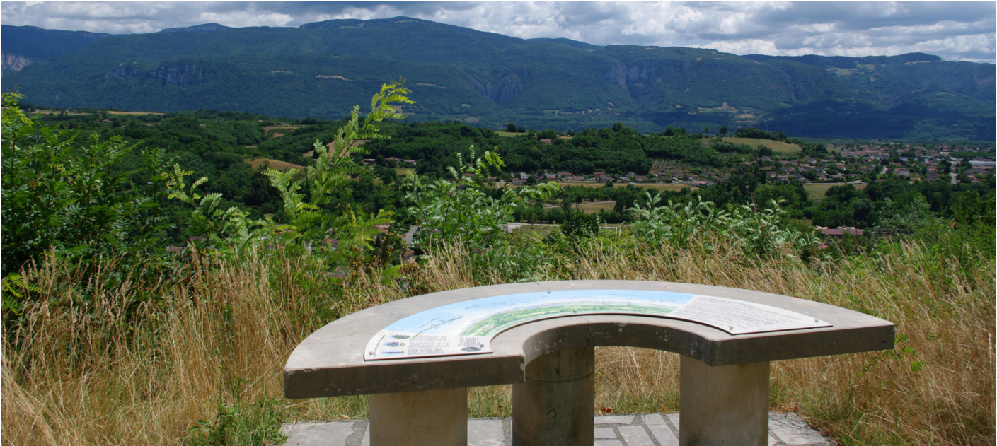
Découvrir la commune