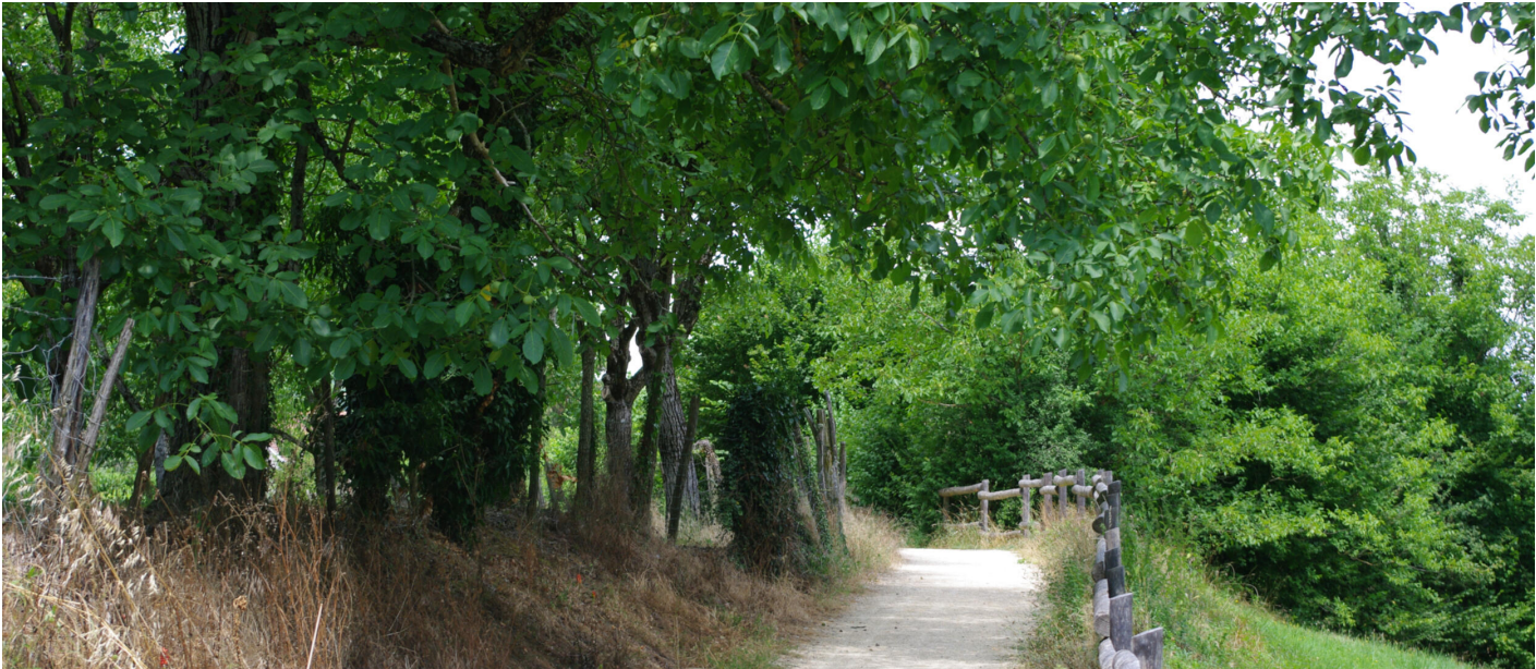
Découvrir la commune