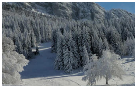
Station des Coulmes