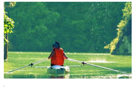
Base d'aviron de La Sone