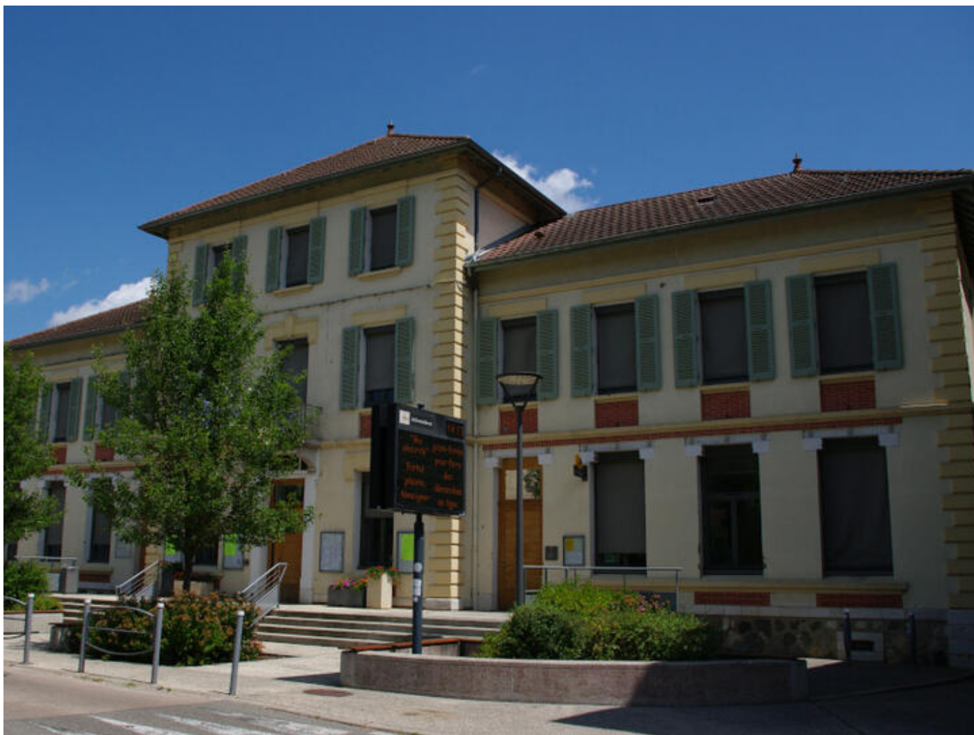
Mairie - Saint-Vérand